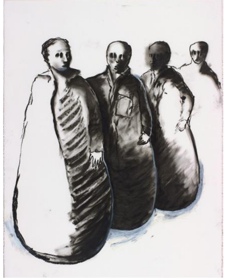
Juan Muñoz, Untitled [İsimsiz] , 1992

İnternette toplanan, paylaşılan ve yorumlanan bilgilerde sürekli bir artışın yaşandığı günümüzde, öğrenciler dijital koleksiyonların kamusal erişim sorununa bir çözüm getirdiğini düşünüyorlar mı? Neden?