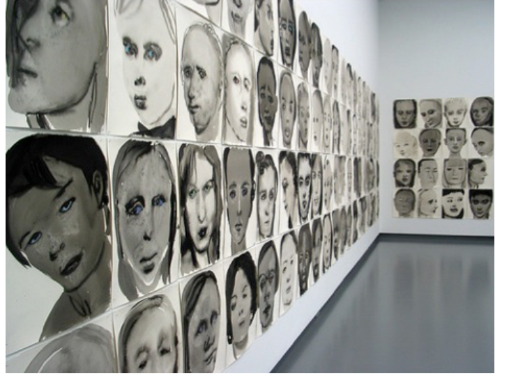
Marlene Dumas, Models [Modeller] , 1994

Yukarıda sıralanan her bölüm, sınıf içi aktiviteler, çoklu medya kaynakları, terminoloji ve tartışma konularını içerir. Bunları, öğrencilerinizin ihtiyaçlarına en iyi cevap verecek şekilde düzenleyerek geliştirmenizi ve kendi müfredatınıza uyarlamanızı öneririz.