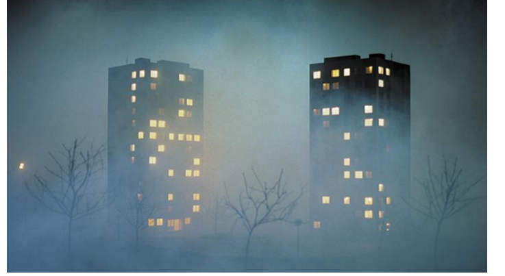
Pierre Huyghe, Les Grands Ensembles [Sosyal Konut], 1994-2001 Van Abbemuseum Koleksiyonu, Eindhoven, Hollanda

4. Öğrencilerinizin bulgularını sınıf olarak tartışın. Koleksiyon hakkındaki izlenimleri neler; içeriğinin gelecek yıllarda nasıl bir değişim göstereceğini düşünüyorlar?