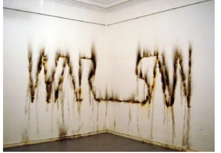
Wilhelm Sasnal, Warsaw [Varşova], 2005

Van Abbemuseum Koleksiyonu, Eindhoven, Hollanda