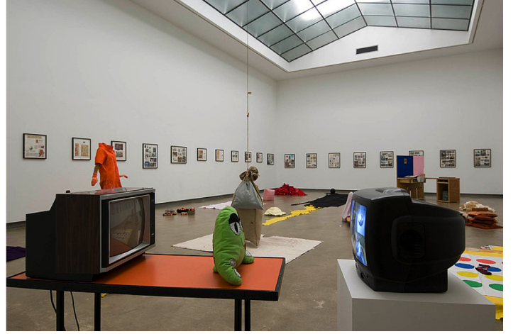
Mike Kelley, Categorical Imperative and Morgue [Kesin Zorunluluk ve Morg], 1999

4. Gruplar, kurumlarının hangi yönde ilerleyeceğine net olarak karar verdiklerinde, koleksiyon geliştirme politikalarının listesini yazmaya başlayacaklar. Örneğin; öğrenciler bir sanat müzesi kuruyorlarsa, ne tür sanat eserleri ya da sanatçılar üzerine odaklanacaklarını ve yeni işlerin alım süreci ile kurumun kısa ve uzun vadeli hedeflerinin ne olacağını değerlendirebilirler. Kılavuz niteliğindeki bu liste, öğrencilerin koleksiyonlarını şekillendirmede en önemli olduğunu düşündükleri standartları ve ilkeleri içermelidir.