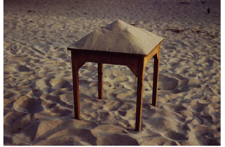
Gabriel Orozco, Sand on Table [Masanın Üstündeki Kum], 1993 Van Abbemuseum Koleksiyonu, Eindhoven, Hollanda