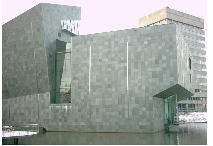
Van Abbemuseum, Eindhoven, Hollanda

Bu serginin açılışından yedi yıl sonra -Hollanda ile Türkiye arasındaki diplomatik ilişkilerin 400. yıldönümünde- SALT ile Van Abbemuseum arasında yapılan iş birliği, küresel bir kültürel değişim ortamında gerçekleşiyor. Batı Avrupa ile ABD'deki kurumlar mali zorluk yaşarken ve geleneksel destek yapıları ile kitlelerini kaybederken, dünyanın farklı bölgelerinde yeni kültürel merkezler oluşuyor. Kültürel kurumlara yönelik talebin yükselen pazarlar ile yeni ekonomilerce teşvik edildiği kentler arasında örneğin İstanbul, Bombay ve Moskova bulunuyor. Söz konusu bu yeni durum, Batı Avrupa müzeleri için zorlu olasılıklar sunuyor. Bu bağlamda, SALT ile Van Abbemuseum arasındaki ortaklığın, sanat müzelerinin 21. yüzyıldaki değişen rolü üzerine bir tartışma ortamı yaratması amaçlanıyor.