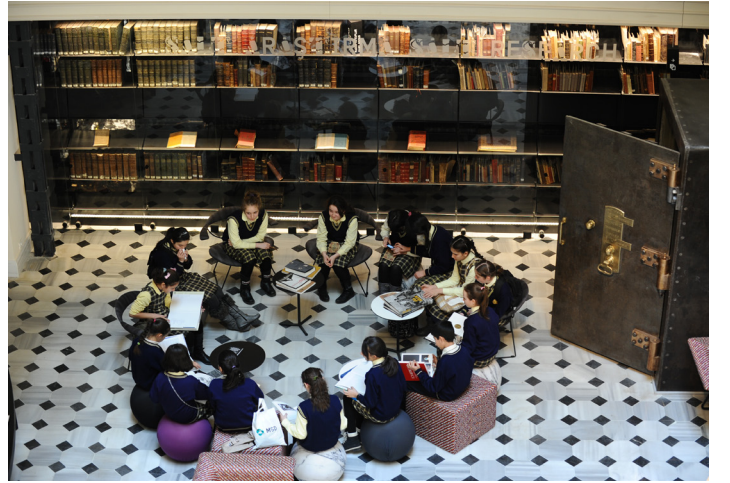
Üsküdar Lions İlköğretim Okulu öğrencileri SALT Galata'da. İstanbul, 2012